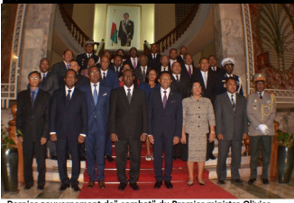
Dernier gouvernement de "combat" du Premier ministre Olivier Mahafaly Solonandrasana, nommé le 10 avril 2016 par le Président