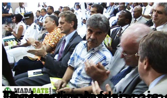
du Ministre des Télécommunications, Postes et Nouvelles