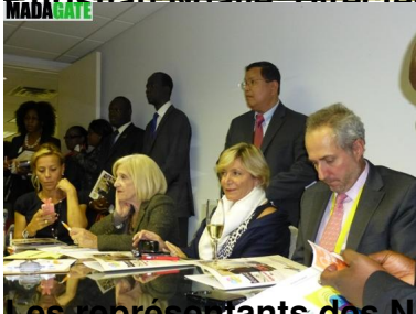
Représentants des Nations Unies