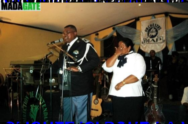
CLIQUEZ ICI POUR LA VIDEO DU DISCOURS DU GENERAL PRUNG RAZA FINDRAKOTO