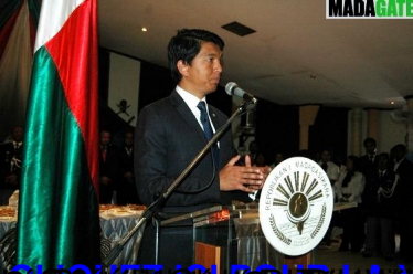
CLIQUEZ ICI POUR LA VIDEO DU DISCOURS DU PRESIDENT ANDRY RAJOELINA