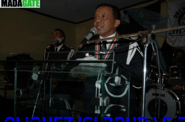
CLIQUEZ ICI POUR LE DISCOURS DU GENERAL RICHARD RAVALOMANANA