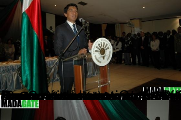
CLIQUEZ ICI POUR LA VIDEO DU DISCOURS DU GENERAL RATSIMANDRAVA RICHARD