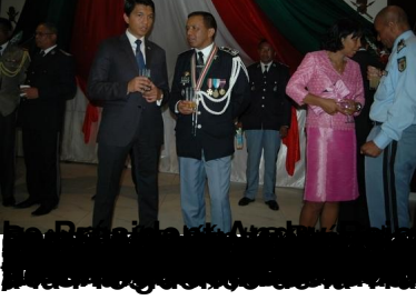
CLIQUEZ ICI POUR LA VIDEO DU DISCOURS DU GENERAL RICHARD RAVALOMANANA EN PLEINE DISCUSSION