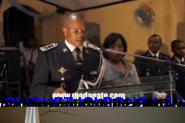
CLIQUEZ ICI POUR LA VIDEO DU DISCOURS DU GENERAL RANDRIANAZARY