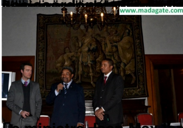
Extrait de son speech