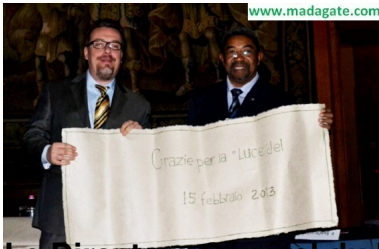
Le Directeur général du Fonds milanais et le ministre malgache du Tourisme