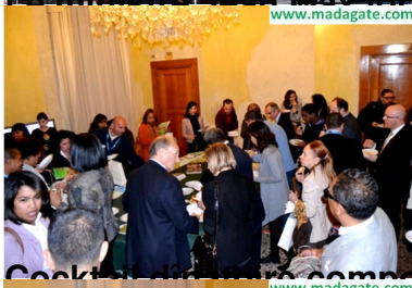
Cocktail de réception composé de plats malgasy et milanais