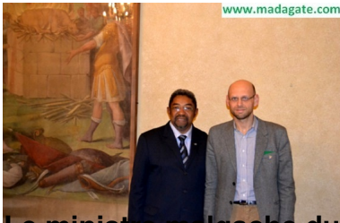
Le ministre malgache du Tourisme et le vice-Président du Conseil provincial de Milan