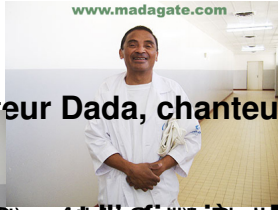
Le Docteur Dada, chanteur auteur compositeur du renommé groupe