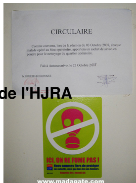
Dans les couloirs du bloc opératoire de l'HJRA