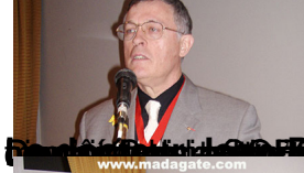
Président de la Société Malgache de Dermatologie et de Pédiatrie (SMDDP)