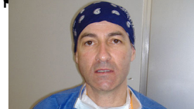
Président de la Société Malgache de Dermatologie et de Pédiatrie (SMDDP)