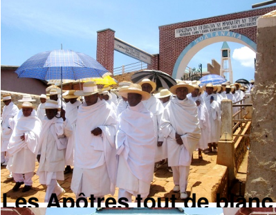
Les Anêtres tout de blanc vêtus impressionnent toujours les étrangers