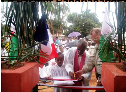
La coupure du ruban devant le kiosque pavoisé du tricolore malgache et français