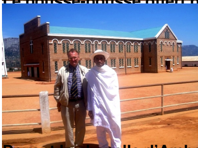
Devant la chapelle d'Ambalatsileo appartenant au Tanàna Avaratra