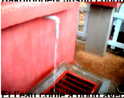
Et l'eau coule à flots avec une pression suffisante