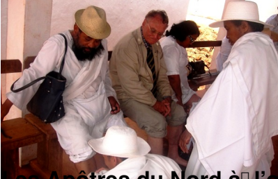
Les Anêtres du Nord à l'œuvre pour effectuer le lavement des pieds aux visiteurs