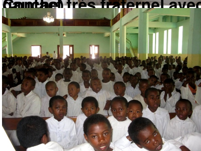
Lors du culte à l'intérieur de la chapelle d'Ambalatsileo