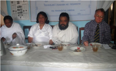
Le rituel de réconciliation se termine toujours par l'agapè