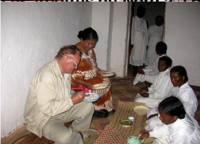
La fille nourricière servant et assistant les visiteurs après le lavement des pieds