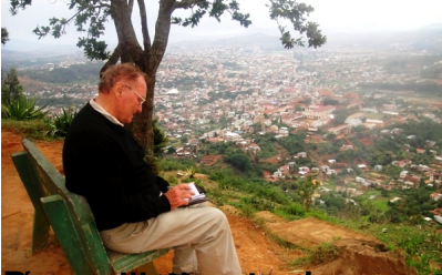
Tout est prêt si le zaka « Point de vue » de Fianarantsoa. Le temps est à la