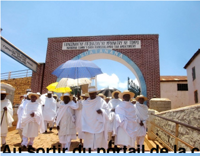
Au sortir du portail de la chapelle