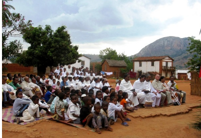
Soatanana constitue un havre de paix