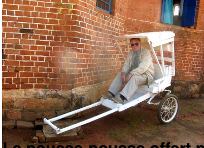
Le pousse-pousse offert pour le déplacement des ray aman-dreny au Tanàna Atsimo