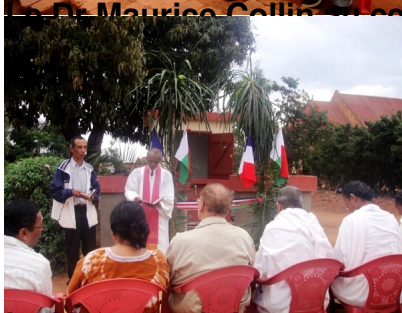
Le kiosque abritant une borne fontaine près de la Station missionnaire de Soatanana