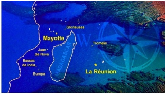
Vu la distance minime entre La Réunion et Madagascar -mais aussi par rapport aux autres îles membres de la COI, la non venue du président français dans la Grande Ile, est un véritable camouflet pour le Président élu par le peuple malgache... Non ?

Plus le temps passe, plus un constat s'étale au grand jour. Hery Rajaonarimampianina n'est qu'un démocrate en apparence mais, dans ses faits et ses actions, c'est le pire des dictateurs car il agit sournoisement. Quel est son rêve? Etre sur la photo de groupe avec les chefs d'Etats francophones de ce monde. Et après le sommet, le déluge.