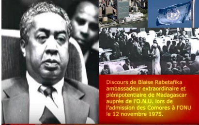
Discours de Blaise Rabetafika ambassadeur extraordinaire et plénipotentiaire de Madagascar auprès de l'O.N.U. lors de l'admission des Comores à l'ONU le 12 novembre 1975.