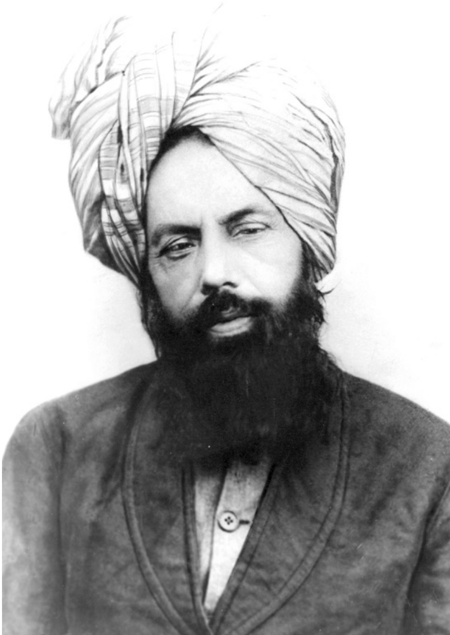
Portrait of the author of the book 'The Ahmadiyya Muslim Community: A History of the Community' (www.madagate.org)