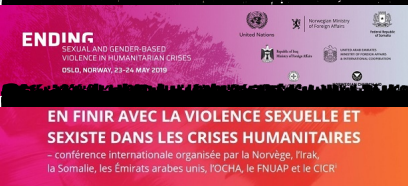
Photo: Mialy Rajoelina, Première Dame de Madagascar, lors de son discours à l'occasion de la conférence internationale sur la fin de la violence sexuelle et sexuelle basée sur le genre dans les crises humanitaires, Oslo, Norvège, le 23 mai 2019.