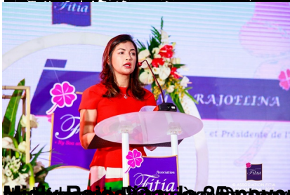
Mialy Rajoelina, le 24 novembre 2019 à l'occasion de la cérémonie de la prise de possession de la présidence de la République à Madagascar.