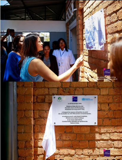
Le samedi 29 novembre 2019, Mialy Rajoelina est rendue à Ambohimandra, y inaugurer le