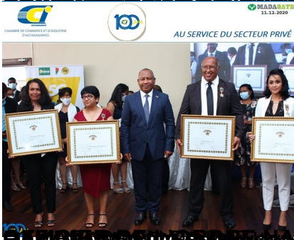
LA VARIANTE EN TOUTES LES LANGUES (Alain (absent sur la photo))