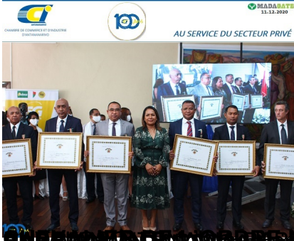
LA VARIANTE EN TOUTES LES LANGUES (Maurisea)