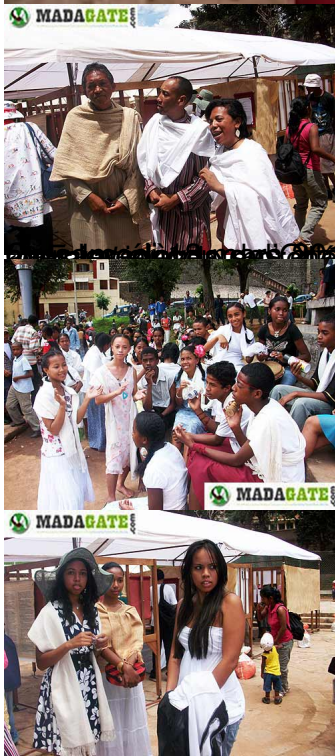
Offices régionaux de la place d'Andohalo (à droite) et la place d'Andohalo (à gauche).