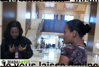
Je vous laisse deviner... Il faut bien du mystère parfois. Non ?