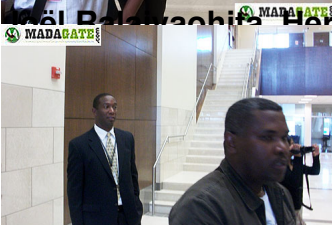
Rednat manana ami de TV RECORD