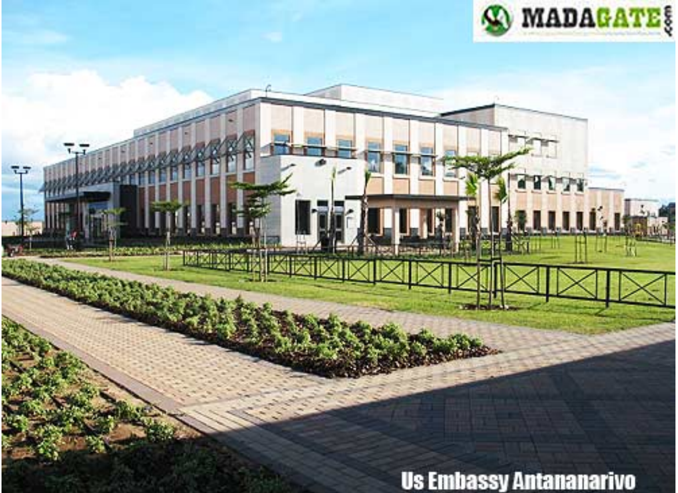
Us Embassy Antananarivo