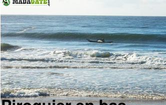
Diroquier en bas