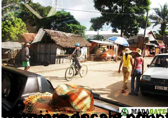
Le village de Vatomandry, dans le sud-est de Madagascar. Tiens, un cycliste "vazaha" qui a compris que