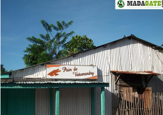
Le pain quotidien avait été livré tôt le matin