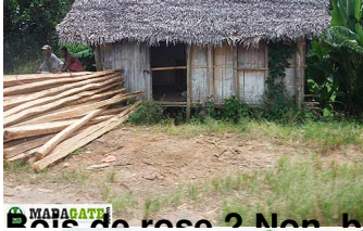
Bois de rose ? Non, bois de construction