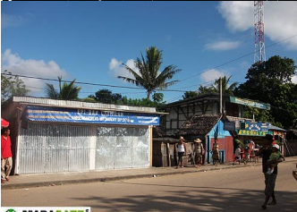
A Vatomandry, la rue principale, c'est ça dans la journée