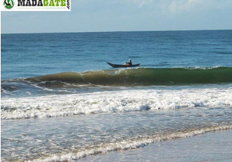
Diroquier en haut