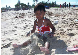
Milieu favorable à la vie. Les petits enfants, à l'appel de l'Anjozorobe, à la gare d'été, jouent parties de