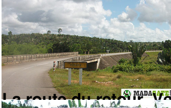
La route du vélo Vatoma Vatomandry et à bientôt !