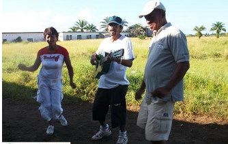
Le village de Vatomandry, dans le sud-est de Madagascar. En attendant le départ, les habitants se préparent.