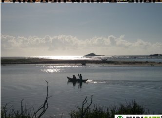
Au fond la mer et ses vagues