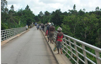
Nous approchons d'Antsampanana, le croisement de la RN2 reliant Antananarivo et