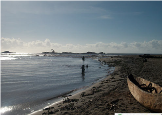
Le point de jonction marqué par une ligne de vagues