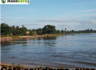
Côte est douce avec le château d'eau au fond