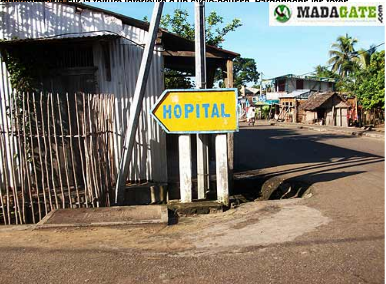
Arrêt à Vatomandry, mais c'est à l'épave responsable de la mer. A Vinany, là où se