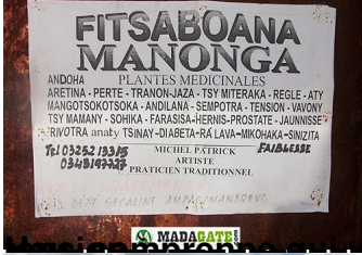
Le village de Vatomandry, dans le sud-est de Madagascar. Ce n'est pas un hasard. Il s'agit d'une publicité pour soigner les maladies liées à la