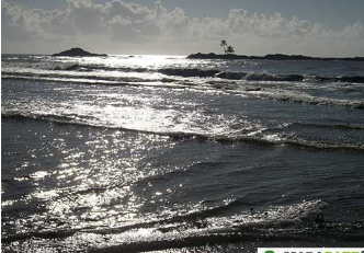
Le point de jonction vu de plus près