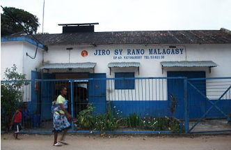
Resort délaissé. La compagnie nationale y a veillé. De toute façon, il n'y en a pas eu