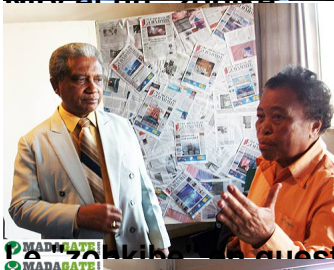
Pas de problème de question et un doyen très farouche du métier