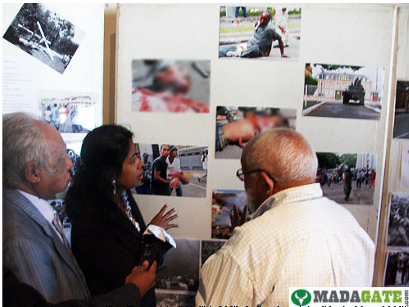
Le 13 mai 2009, à Antananarivo, des journalistes de l'agence Madagate.com sont devant la façade de la présidence de la République, à l'occasion de la manifestation des journalistes.