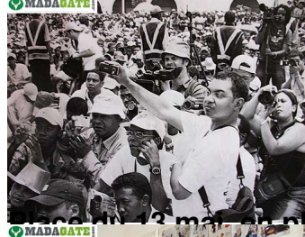
Le 13 mai 2009, à Antananarivo, les journalistes de l'agence Madagate.com sont devant la façade de la présidence de la République, à l'occasion de la manifestation des journalistes.