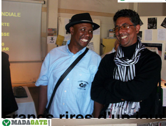
France rires d'un journaliste et d'un "mpikabary"...