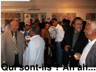
Qui sont-ils ? Ah ah...