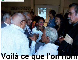
Voilà ce que l'on nomme photojournalisme de groupe par excellence