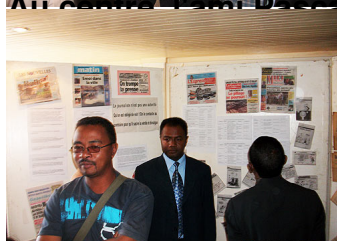
Mais, trop nombreux pour être énumérés, énormes quant à leurs noms