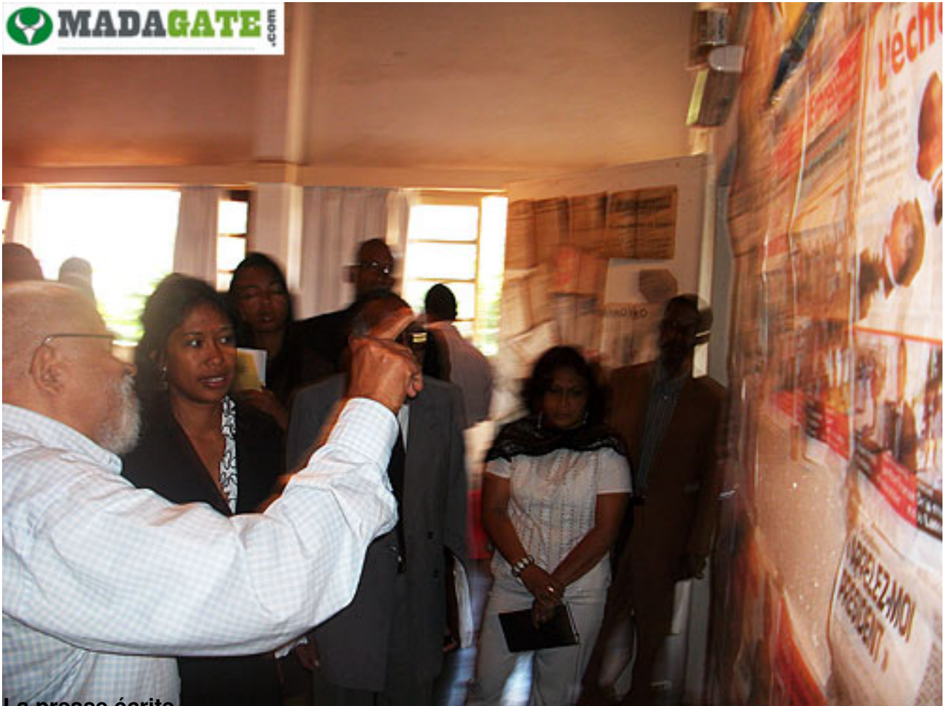
La presse écrite