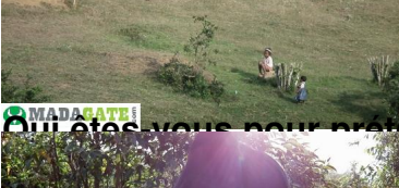
Qui êtes-vous pour prétendre que ces villageois malgaches ne sont pas heureux ?