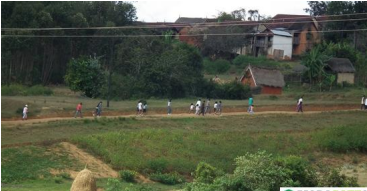
Les autres sont allés faire de la marche