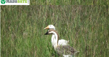
Ces oies nous observent, curieuses