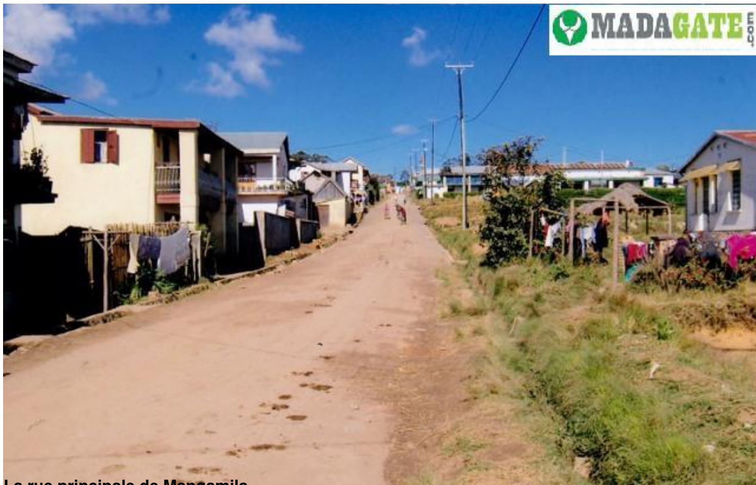
La rue principale de Mangamila