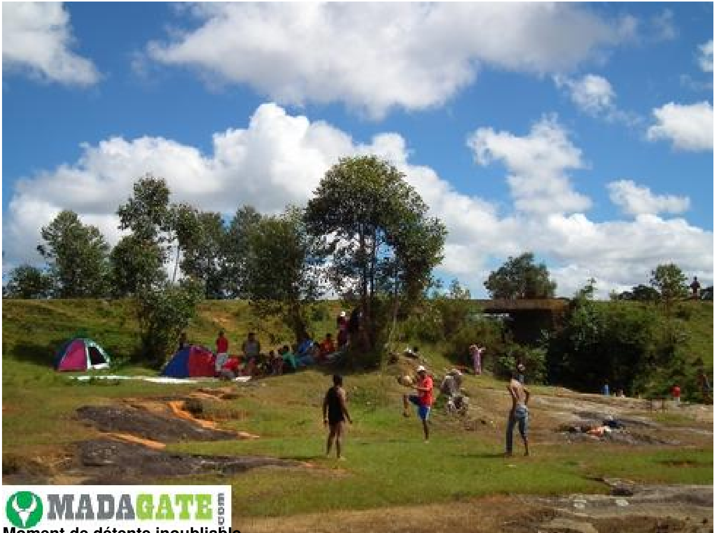
MADAGATE Moment de détente inoubliable