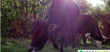
L'autre richesse à Madagascar : les zébus