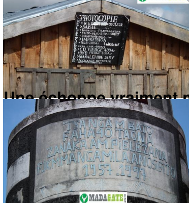
Une échoppe vraiment multiservices...