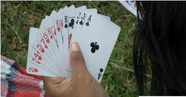
Les cartes gagnantes