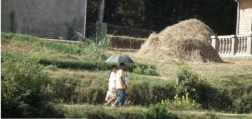
L'enfant est sage chez les Malgaches, vous ai-je dit