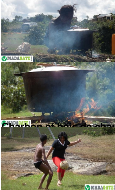
Charbon et bois de chauffe sont achetés sur place