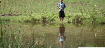
Cet enfant goûte aux joies de la pêche