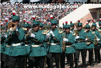
...lmane était représentée dont présente