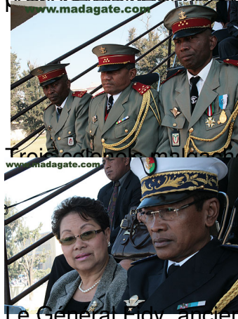
Les tribunes de Mahamasina. Ici même