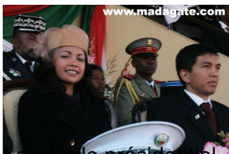
Ab la belle coiffure de Mialy Rajoelina qui fera encore des jalouses