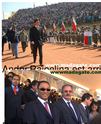
Andry Rajoelina est arrivé. Il va passer à la revue des troupes, loin des tribunes officielles