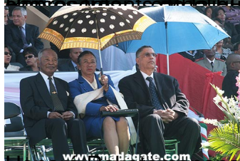
et son épouse ; Me Jacques Sylla