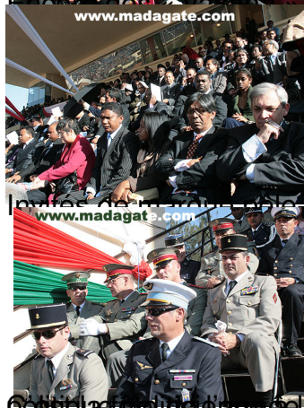
Le salut au drapeau. Sur l'étendard : « Miaraka ka reseo » ou ensemble nous vaincrons