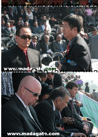
le marocain) et le correspondant de l'agence de presse chinoise XHINUA