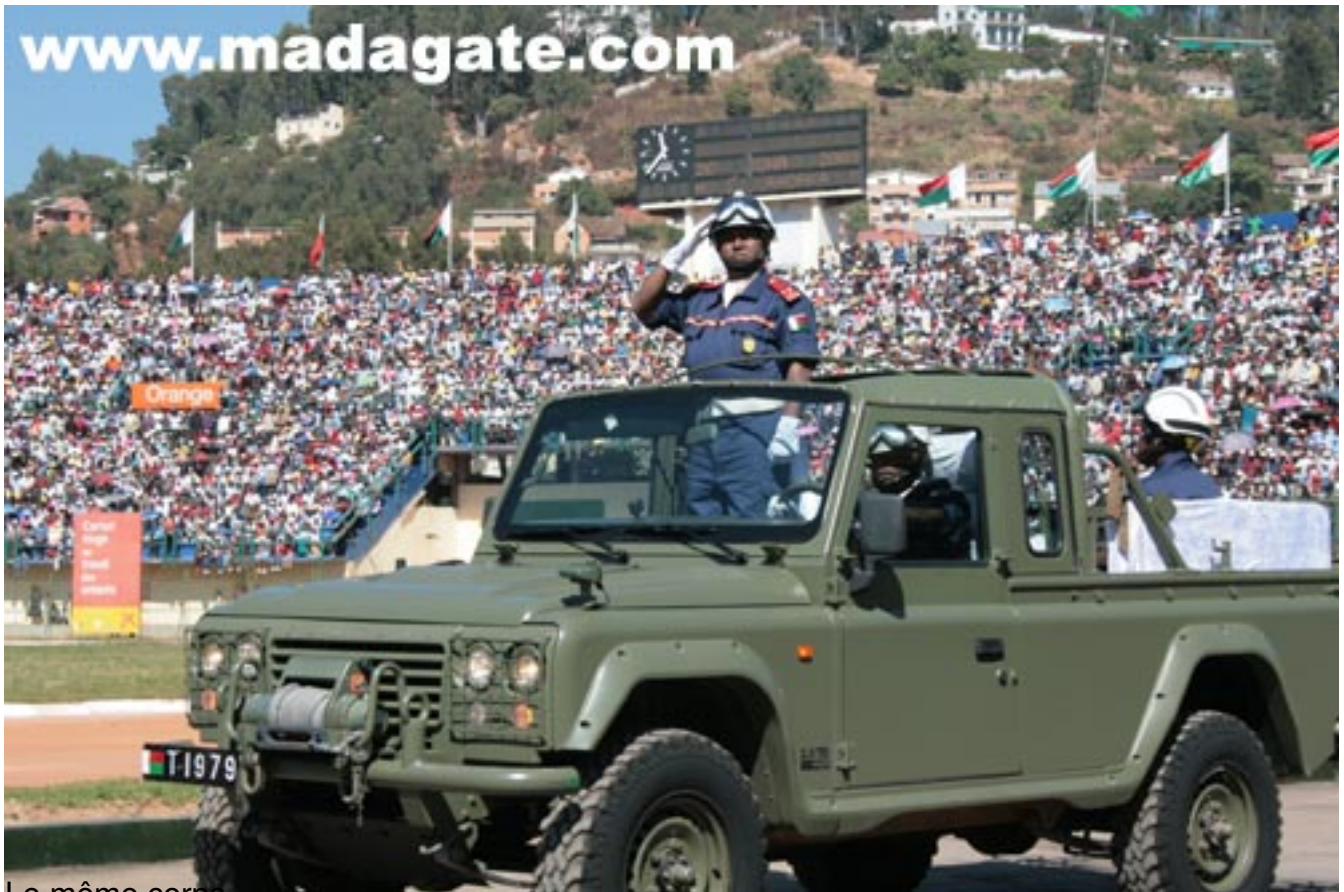
Le même corps