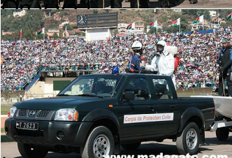
Le corps de protection civile