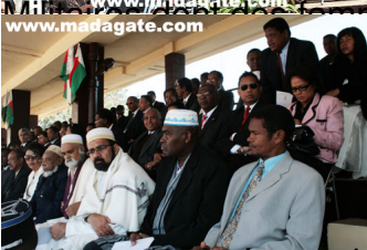
...mes, en bas. C'est leur fête !