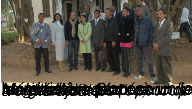
Le directeur général de la Fédération Malagasy de la Résidence est un