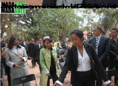
2019 Sa hien'ny olo sy ta'ny Bilita ny medi-pa'risy n'ny et'ny Fakoan