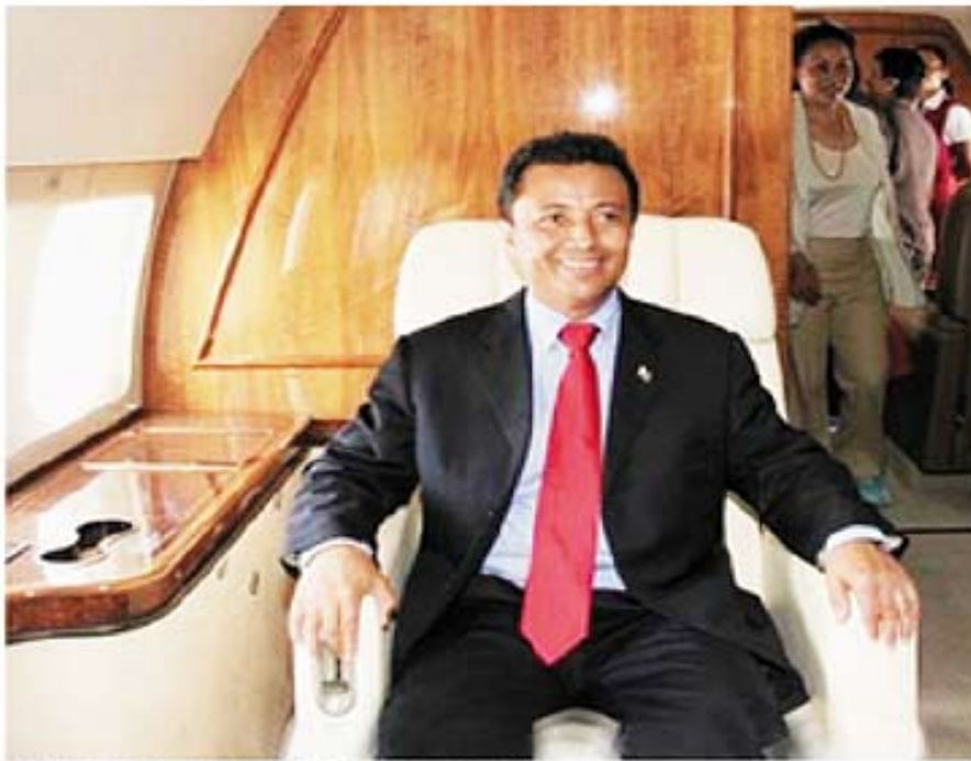
Marc Ravalomanana lors de la présentation de l'avion à l'île de la Réunion à Noël.

L'ancien président de la République a écopé de quatre ans de prison ferme à l'issue d'un procès concernant l'achat de l'avion présidentiel. Le verdict a été rendu mardi par contumace.