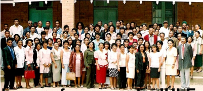
Les professeurs du JULF en 2004