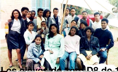
Les élèves de Terminale D8 de 1991