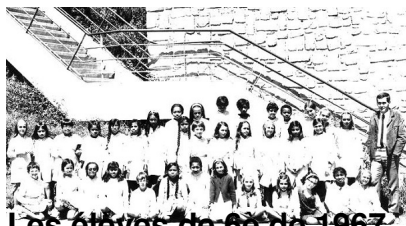
Les élèves de 6e de 1967