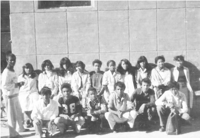
Les élèves de 2 è 6 de 1982