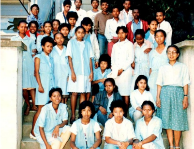
Les élèves de Terminale D8 de 1985