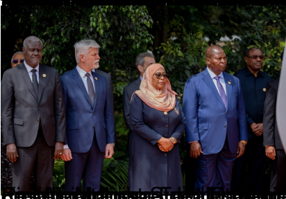
Le président américain Joe Biden (au centre) et le président rwandais Paul Kagame (à gauche) lors d'une cérémonie à Kigali, le 14 avril 2024. À droite, le président français Emmanuel Macron.