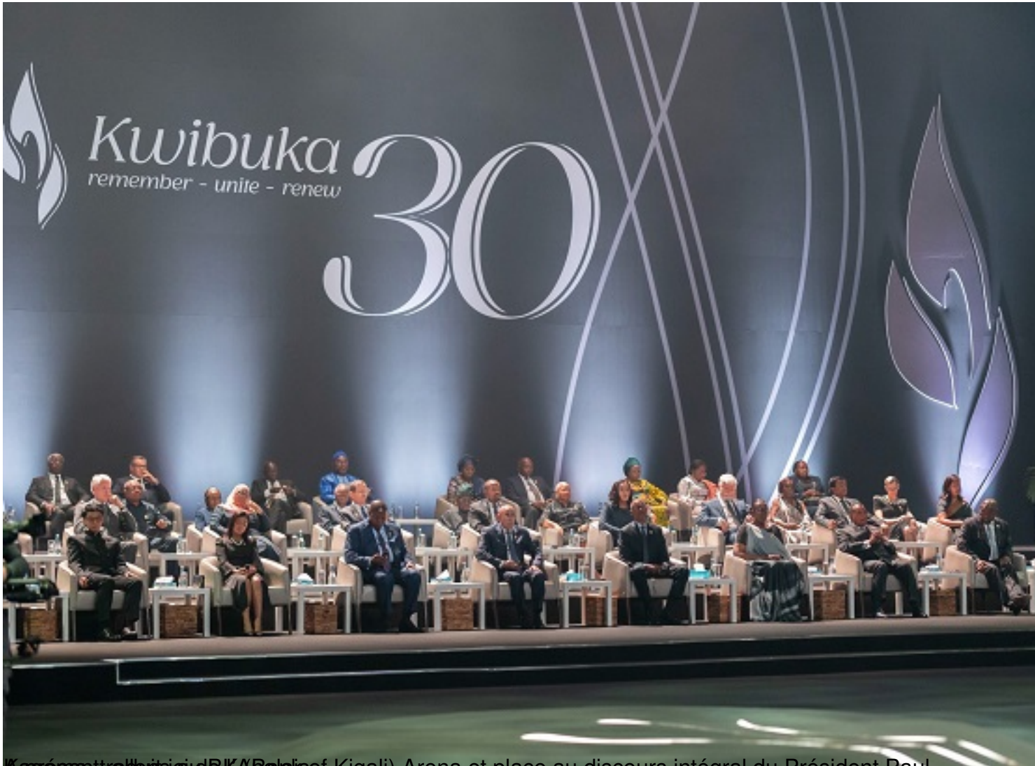
Kwibuka 30 (à l'initiative de RUKAB) (Bolsos Kigali) Arena et place au discours intégral du Président Paul